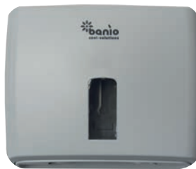
M ~500 Blatt