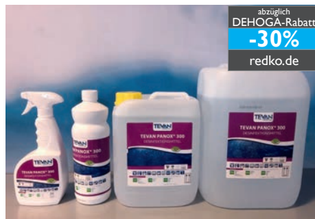
wirkungsstarke Flächendesinfektion begrenzt viruzid wirkt stark gegen z.B. Coronaviren