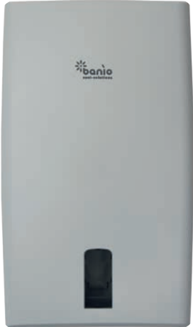
XL ~1000 Blatt