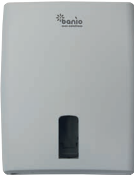
L ~750 Blatt